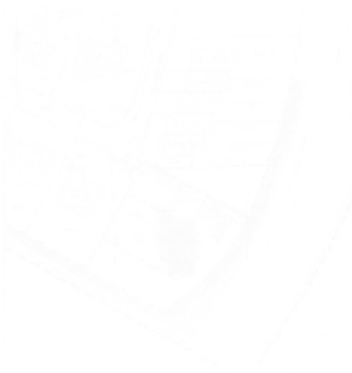
Figure 2. The map of the study area showing the location of the study sites.

Figure 1. The map of the study area showing the location of the study sites.